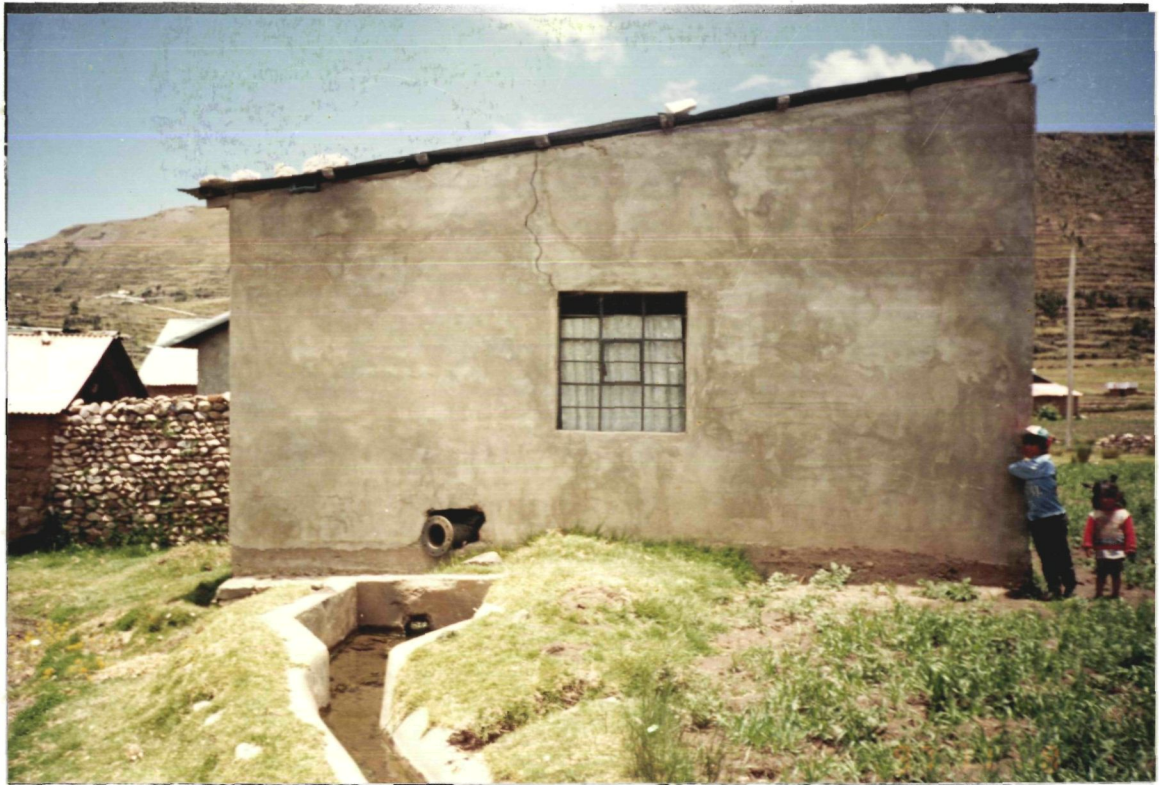
FOTO N° 01 Se aprecia el estado de la caseta antes de la rehabilitación.