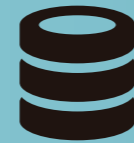
Bases de datos