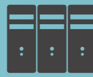
Control de datos