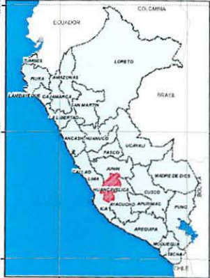
MAPA DE UBICACION PROVINCIAL COMITE DE USUARIOS HERGERAN Y LLANANACO