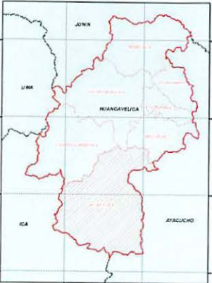
MAPA DE UBICACION DISTRITAL COMITE DE USUARIOS DEL CAUCE ALLACA