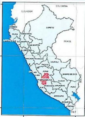
MAPA DE UBICACION PROVINCIAL COMITE DE USUARIOS DEL CAUCE ALLACA