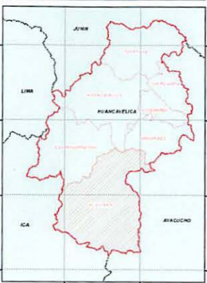
MAPA DE UBICACION DISTRITAL COMITE DE USUARIOS LLINCANCA