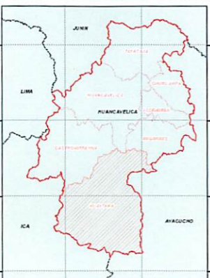
MAPA DE UBICACION DISTRITAL COMITE DE USUARIOS HUANCARROSA