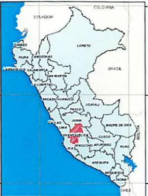
MAPA DE UBICACION PROVINCIAL COMITE DE USUARIOS HUANCARROSA