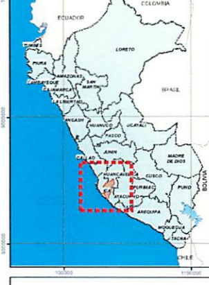
MAPA DE UBICACION HIDROGRAFICA DE LA CUENCA DEL RIO ICA