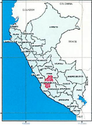
MAPA DE UBICACION PROVINCIAL COMITE DE USUARIOS COCHACC