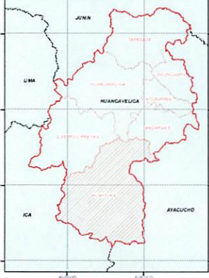
MAPA DE UBICACION DISTRITAL COMITE DE USUARIOS COCHACC