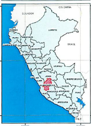
MAPA DE UBICACION PROVINCIAL COMITE DE USUARIOS DEL CAUCE DE SUYO