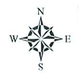
MAPA DE UBICACION HIDROGRAFICA DE LA CUENCA DEL RIO ICA

Departamento de Huancavelica Provincia de Huaytara Distrito de San Francisco de Sangayaco