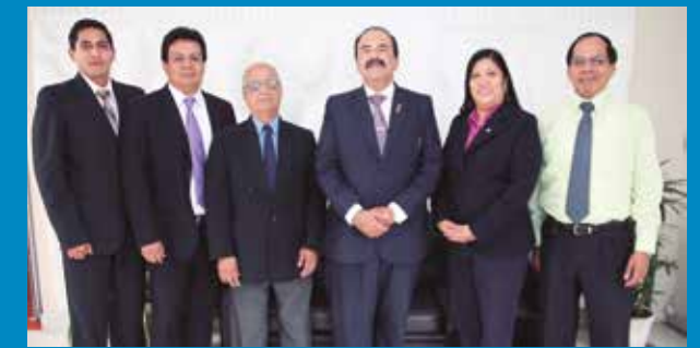
Director de OPP y el equipo de la Unidad de Planeamiento y Modernización de la ANA

Los contenidos de esta publicación solo podrán ser reproducidos con autorización de la Autoridad Nacional del Agua, incluyendo autoría y fuente de información.